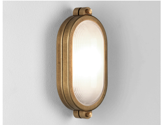
CODE: 1387004 FINISH: SOLID BRASS

THIS PRODUCT IS NOT SUITABLE FOR INSTALLATION WITHIN FIVE MILES OF THE COAST. FOR THESE ENVIRONMENTS, PLEASE FILTER PRODUCTS ON THE ASTRO WEBSITE BY 'COASTAL'.