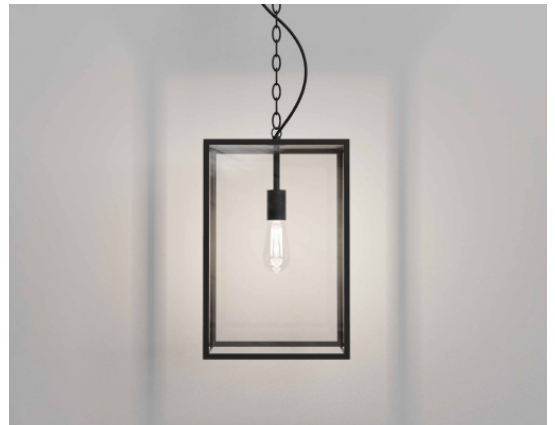
CODE: 1095033 FINISH: TEXTURED BLACK

THIS PRODUCT IS NOT SUITABLE FOR INSTALLATION WITHIN FIVE MILES OF THE COAST. FOR THESE ENVIRONMENTS, PLEASE FILTER PRODUCTS ON THE ASTRO WEBSITE BY 'COASTAL'.